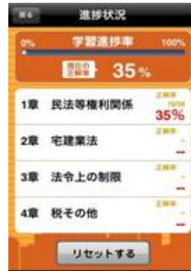
進捗管理モジュール