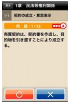
〇×式問題回答モジュール