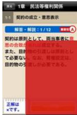
ソノシート効果モジュール