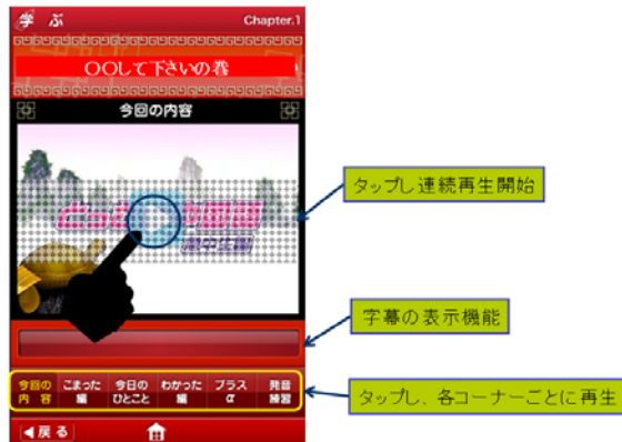
語学学習モジュール